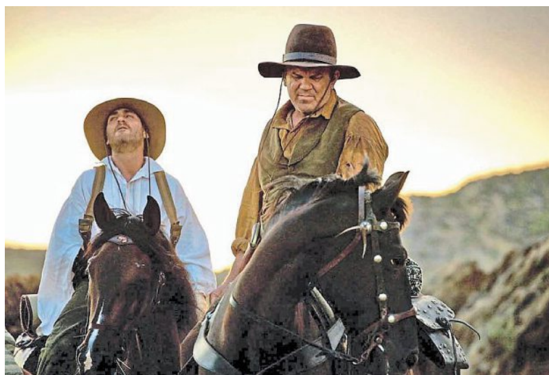
« Les frères Sisters », un film de Jacques Audiard.

Talmont-Saint-Hilaire - Le Manoir, 11 ter, avenue des Sables Dogman (VO) : 20 h 30.