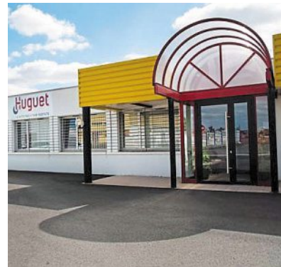
L'entreprise est désormais installée dans la zone industrielle de Sébastopol.

Luçon — 1928 - 2018. De la machine à laver Vedette à la fusée Ariane, Huguet a toujours été dans l'air du temps. Ce week-end, l'entreprise fête en « famille » son anniversaire.