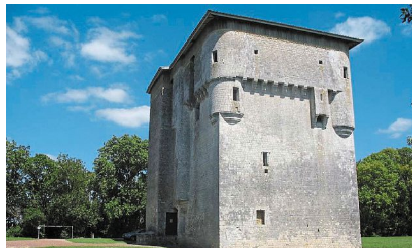
La tour de Moricq sera au cœur de la scénographie.

Une scénographie, retraçant 800 ans d'histoire de la tour de Moricq, se prépare. 200 bénévoles sont mobilisés.