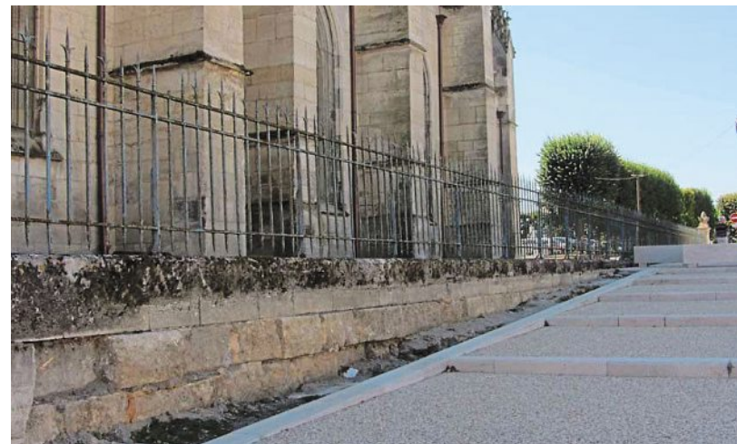
Les grilles qui entourent la cathédrale vont être démontées, réparées, traitées contre la rouille et repeintes. Le coût est partagé avec l'État. 26 000 € restent à charge de la Ville.